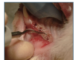
歯槽骨の形成 (トリミング)

用途：犬・猫の全臼歯抜歯、全顎抜歯、歯肉粘膜の剥離、歯槽骨の切削、歯槽骨形成、破折・残根時の歯根除去、難抜歯の処置