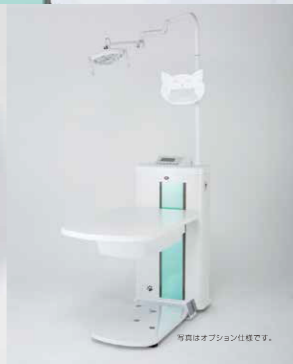
写真はオプション仕様です。