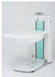
エメラルドグリーン