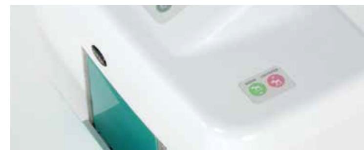
便利なメモリースイッチ・ローポジションスイッチ