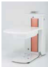
マリーゴールドオレンジ