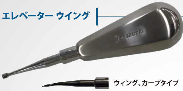
ウイング、カーブタイプ